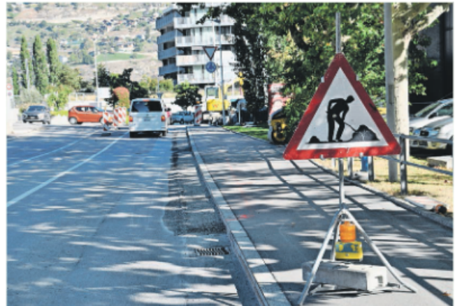
Kreisel Landbrücke. Von Stalden herkommend fahren wieder zwei Spuren bis zum Kreisel.

Die Eröffnung der gesamten Südumfahrung ist für Mitte 2024 terminiert. «Wie die Vergangenheit gezeigt hat, hängt dies jedoch von vielen Faktoren ab», gibt Hutter abschliessend zu verstehen.